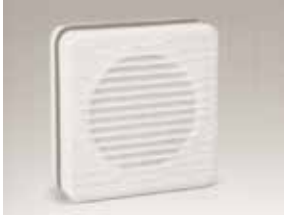
Pencere kiti / Window kit

Tek harekette açılan dekoratif ön panel Single action open front panel