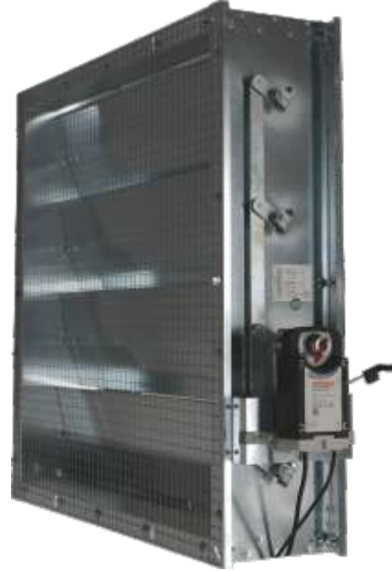
Ölçüler / Dimensions